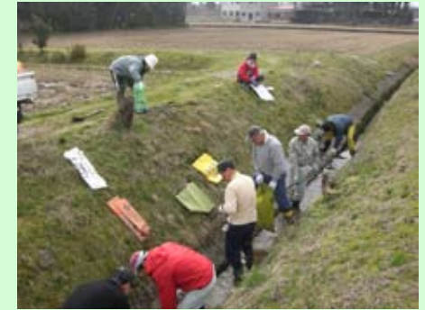
排水路の泥上げ作業