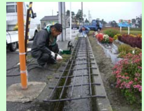
転落防止網の設置作業