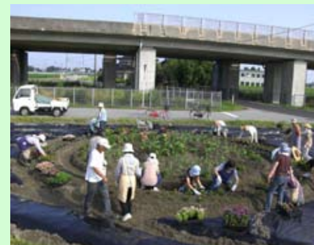
休耕田を利用した花壇への植栽作業