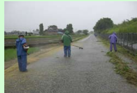
用排水路及び農道法面の草刈作業